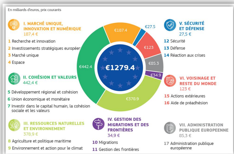
Le nouveau cadre financier pluriannuel 2021-2027 (en milliards d'euros, prix courants) Source : Commission européenne - Un budget de l'UE pour l'avenir.

Les propositions de règlements des Fonds ont également été publiées. La Commission européenne souhaite rendre les règlements plus flexibles, simples et transparents . Bonne nouvelle pour la Wallonie, la Commission propose une politique de cohésion pour toutes les régions et la catégorie des « régions en transition » est maintenue !