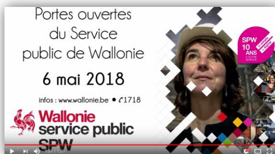
Découvrez la vidéo consacrée à la journée du 6 mai et à la diversité des métiers au sein du SPW

En 2008, le Ministère de la Région wallonne (MRW) et le Ministère wallon de l'équipement et des transports (MET) fusionnaient pour devenir le SPW : le Service public de Wallonie . A cette occasion, au mois de mai dernier, 10 sites de l'administration wallonne ont été ouverts au grand public. Près de 4 000 visiteurs ont ainsi pu être accueillis et guidés par des agents régionaux ravis de montrer leur quotidien au public. Forestiers, hydrauliciens, gestionnaires de trafic, agents de call-center, plongeurs, tailleurs de pierre, topographes,... autant de métiers que les Wallonnes et les Wallons ont pu découvrir.