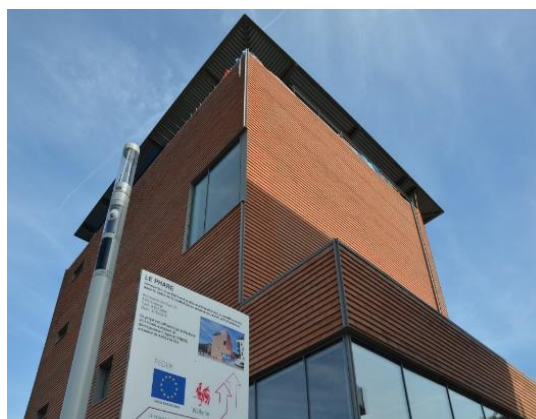
Bâtiment « Le Phare » d'Andenne

Les grandes villes ont également continué le suivi de leurs chantiers durant la crise. Parmi celles-ci, on peut notamment citer la ville de Namur, où la dynamique de développement s'est poursuivie avec l'aménagement de l'Esplanade en espace piéton à destination du tourisme, des citoyens et du secteur de l'évènementiel. La construction du "NID" (Namur Intelligente et Durable), lieu d'innovation, est en cours de réalisation et l'Enjambée (passerelle cyclo piétonne) est ouverte au public depuis mi-mai. Citons également Verviers, dont le chantier de redynamisation urbaine du centre-ville a pris une vitesse de croisière avec la rénovation de la place Verte dans l'hypercentre, mais également Andenne et son bâtiment emblématique « Le Phare » (regroupant la Bibliothèque, l'Office du tourisme et l'Espace Muséal d'Andenne), qui est à présent terminé et ouvert au public .