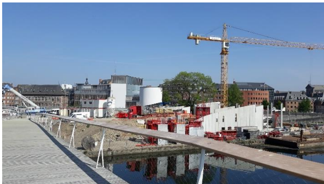
Vue sur le site de la Confluence