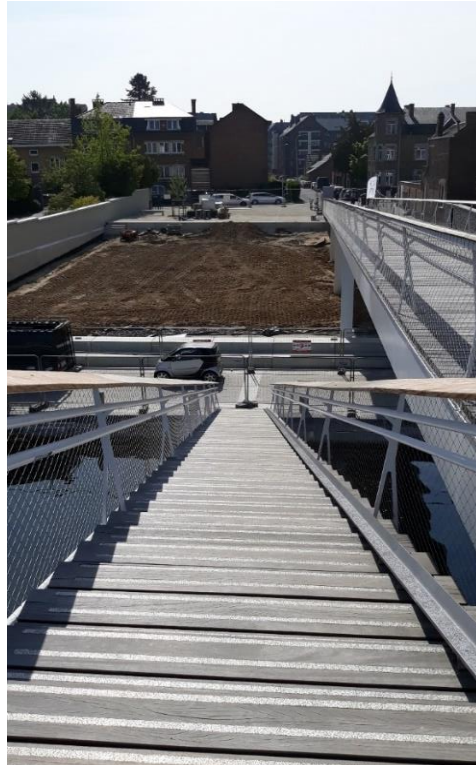
Entrée de l'Enjambée et descente sur les quais côté Jambes

Cet ouvrage d'art, d'un montant global de 6,2 millions €, financé en partie par l'Europe et la Wallonie, vient compléter l'ambitieux chantier de dynamisation du site de la Confluence, également cofinancé par le FEDER et dont l'objectif est de renforcer l'image de ce lieu historique et emblématique de la ville de Namur et de le positionner comme « vitrine de la ville intelligente, capitale d'une Wallonie innovante ».