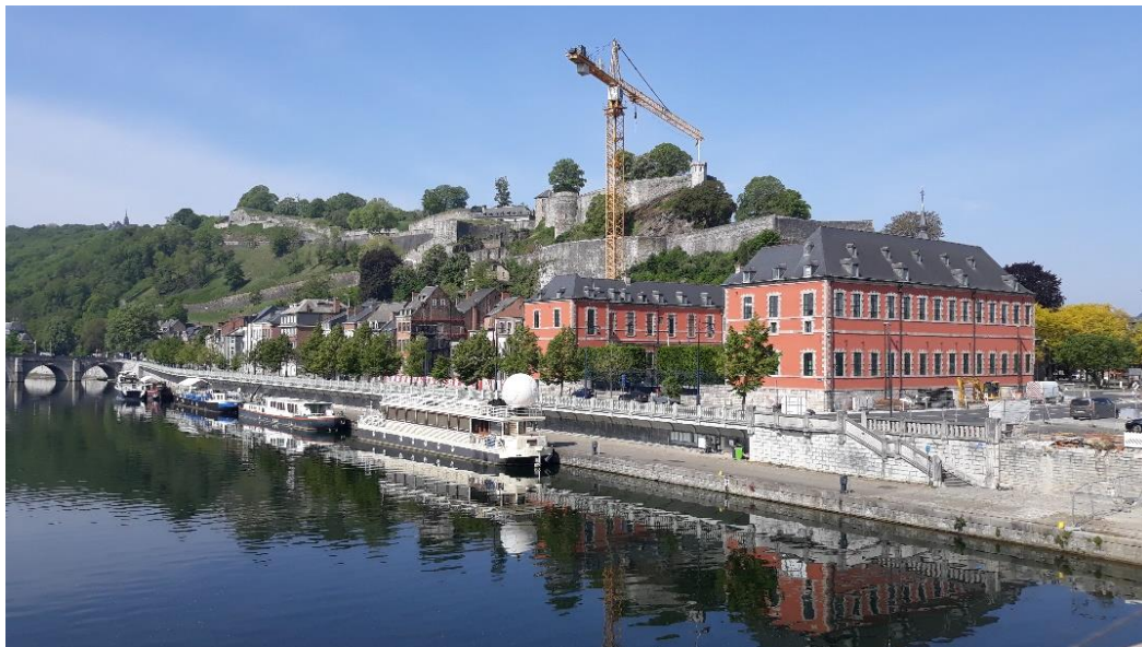
Vue sur la Citadelle

Située à deux pas des sièges du Gouvernement et du Parlement de la Wallonie, cette fine et élégante passerelle cyclo-piétonne, longue d'une centaine de mètres et large de six, se fond dans les paysages aval et amont de la Meuse sans cacher le magnifique point de vue sur la Citadelle.