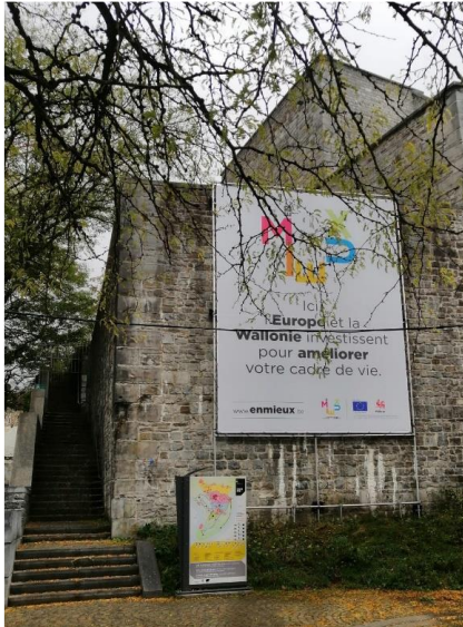
Namur et l'aménagement de son centre névralgique dans le quartier du Grognon et de la Citadelle