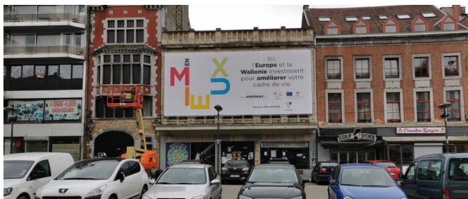
Verviers et sa revitalisation urbaine