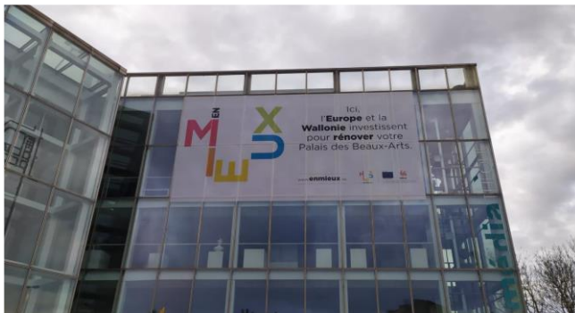
Charleroi et la rénovation de son Palais des Beaux-Arts

Par ailleurs, crise sanitaire oblige, l'événement annuel 2020 « En Mieux » a vu le jour sous format digital. Le site http://enperspectives.be , présente des projets inspirants qui font bouger votre région. Au travers d'articles, reportages, interviews, photos, vidéos et de chiffres couvrant six thématiques spécifiques, nous vous avons une fois de plus démontré à quel point l'Europe, la Wallonie, la Fédération Wallonie-Bruxelles et la COCOF investissent pour vous... pour nous offrir à toutes et tous de belles perspectives d'avenir