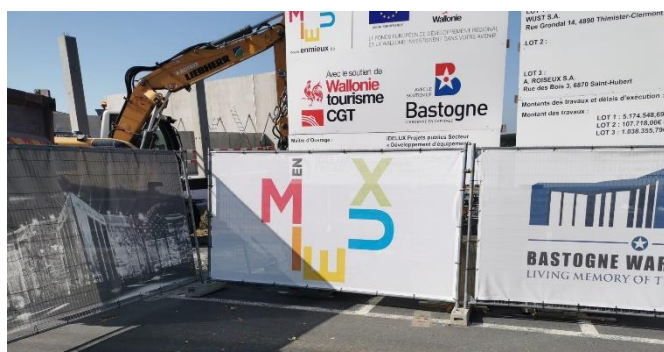
Bastogne et son nouveau pôle événementiel près du Bastogne War Museum