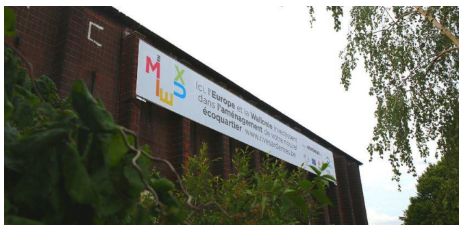
Liège et son futur écoquartier de Coronmeuse