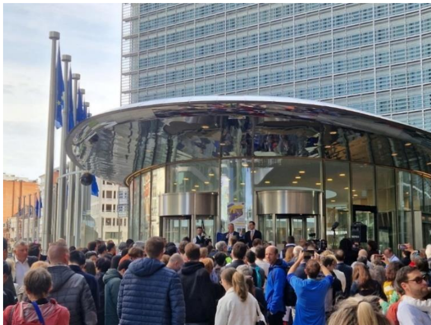
Entrée du Berlaymont, bâtiment principal de la Commission européenne situé à Bruxelles, lors de la Journée « Portes ouvertes » du 06 mai 2023. Des citoyens de toute l'Europe ont répondu en nombre à l'invitation.

Parce que l'Europe, ça se fête, le Département de la Coordination des Programmes FEDER était présent lors de la Journée « Portes ouvertes » des institutions européennes du 6 mai, évènement grand public organisé par l'Union européenne pour faire découvrir à tous ses institutions et son fonctionnement. Arrêt en image sur cette belle journée aux couleurs de l'Europe.