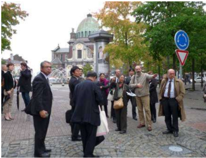
La présentation du projet Phénix in situ