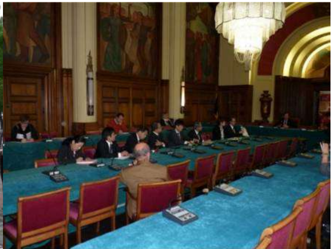
La délégation japonaise accueillie à l'hôtel de Ville de Charleroi

Grâce au FEDER et à la Wallonie, et au portefeuille de projets Phénix, le cœur de Charleroi renaît de ses cendres et offre à ses habitants, ses commerces et ses touristes un environnement en harmonie avec les nombreuses pulsations urbaines.